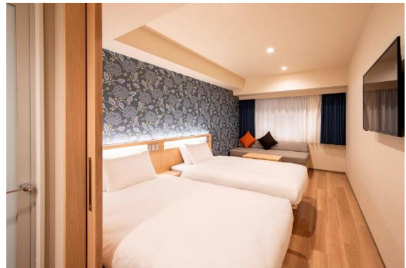
スタンダードツイン with Sofa Bed 21.7㎡～22.3㎡