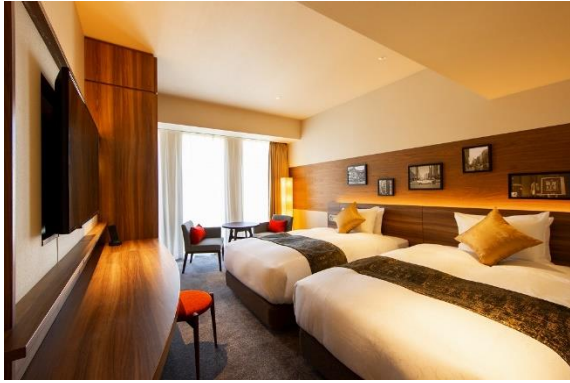
スーペリアツイン 26.0㎡～27.1㎡