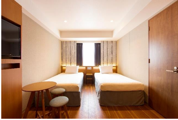
スタンダードツイン 21.9㎡