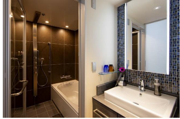
独立した洗面所・バスルーム・トイレ