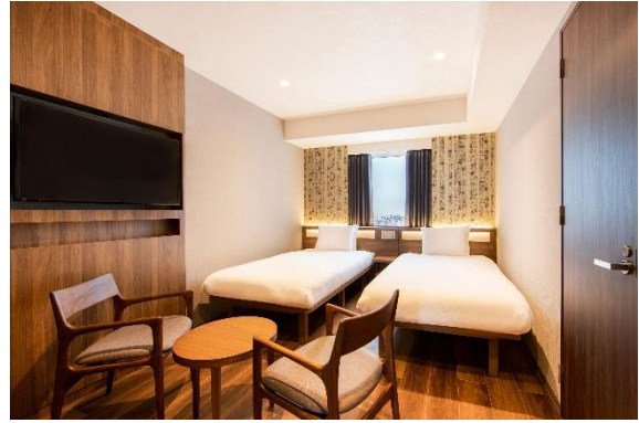
ハイフロアスーベリアツイン 23.2㎡~25.2㎡

「からくさホテル」は、2016年3月に誕生した観光客向け宿泊特化型ホテルです。国際空港・ターミナル駅近くや観光都市に位置し、平均20㎡以上のツインルームを軸に、ファミリーやグループ利用に最適なコネクティングルームを全体の約5割設けているのが特徴です。さらに、全館無料Wi-Fiや、各室のバスルーム、洗面所、トイレを独立させるなど、観光客向け機能・サービスが充実したホテルです。現在、札幌に1軒、東京に2軒、関西に5軒の計8ホテルを経営・運営しています。