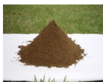
フルボ酸エキス抽出海洋性土壌