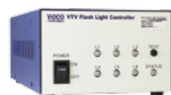
フラッシュライトコントローラ (6ch)