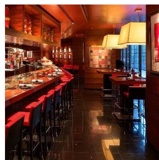
ラトリエドゥ ジョエル・ロブション(六本木)