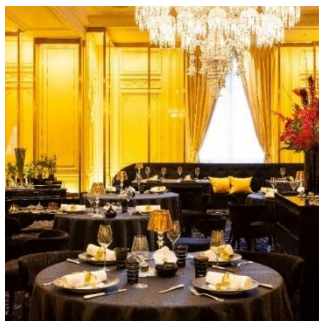
ガストロノミー “ジョエル・ロブション” (恵比寿)

Instagram : https://www.instagram.com/robuchon_tokyo