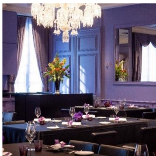
ラ ターブルドゥ ジョエル・ロブション (恵比寿)