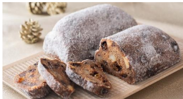
画像左「ロブションのシューレーン」 画像右「シューレーン ショコラ」