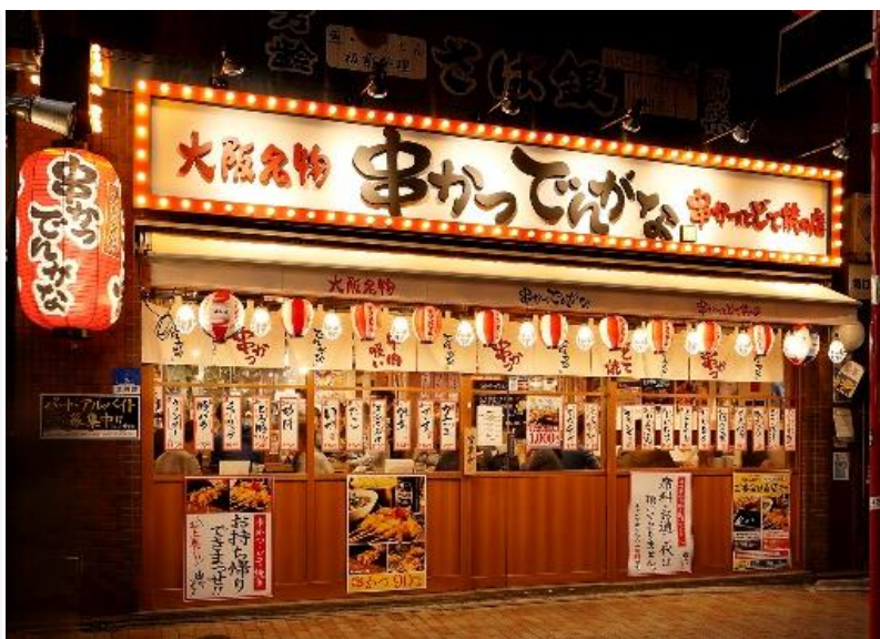
串かつ でんがな 八重洲店