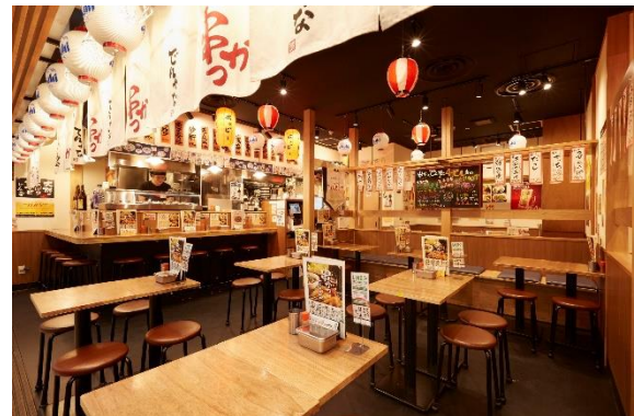
串かつ でんがな 大阪駅前第4ビル店