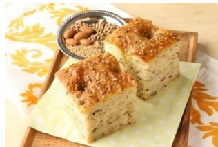
かぼちゃのパンドミ 栗かぼちゃのグラタンキッシュ フォカッチャ(クミン)