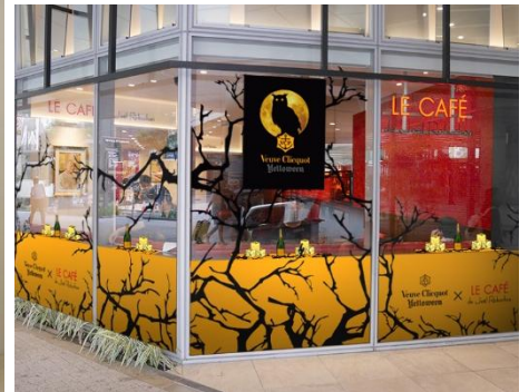
< 店舗イメージ >