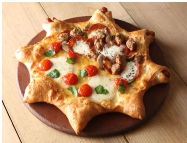
ピザーラスターズ マルゲリータ&ニューヨーカー

PIZZA-LAならではの「こだわりのおいしさ、楽しさ、感動」を詰め込んだ商品を是非皆様でお楽しみください。