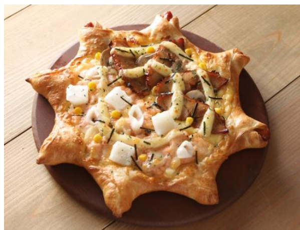
ピザーラスターズ テリヤキ&もち明太子