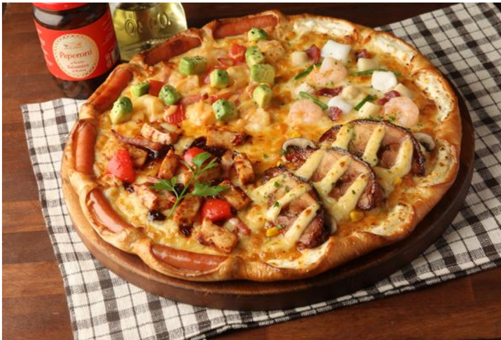
<みみまでハワイアンクォーター>

その他、好評いただいているハワイアンシリーズの2商品である、ハワイ産マウイオニオンの甘みを活かした絶品BBQソースとジューシーなチキンが魅力の「ハワイアンBBQ」や、夏の定番エビマヨにアボカドをプラスし、ハイビスカスソルトをかけるとさらに美味しい「エビマヨ アロハ」のほか、人気定番の「テリヤキチキン」、「シーフードイタリアーナ」を加えた「ハワイアンクォーター」も、引き続きご提供していきます。