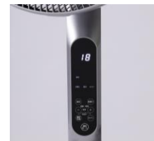
静電タッチパネル

本体操作部には、デジタル表示で運転状況が一目で分かり、触れるだけで操作できる静電タッチパネルを採用。また、風量、運転モード、タイマーなどの運転状態が手元で確認できる液晶画面で、操作がしやすいリモコンを付属しています。