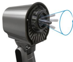
回転軸の旋回イメージ