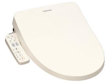
SCS-SCK7010 (N)バステルアイボリー

温水でノズルを洗浄・除菌。好みのノズル位置、水勢、温水温度を記憶する「メモリー機能(1メモリー)」を搭載した瞬間式温水洗浄便座「SCS-SCK7010」を9月上旬に発売します。(ウルトラファインバブルは搭載していません。)