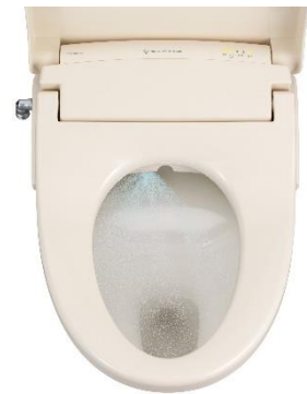
「ウルトラファインバブル プレケアミスト」イメージ