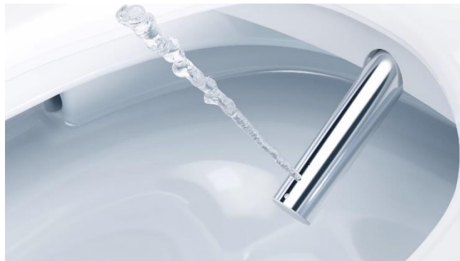
「エアインすっきり水流+(プラス)」

ウルトラファインバブルを含んだ洗浄水の水勢をエアポンプの力で上げて、やさしくすっきり洗浄します。