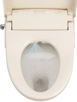
「ウルトラファインバブル プレケアミスト」

ウルトラファインバブルを含む洗浄水を約1時間毎に自動で便器内壁に噴射し、黒ずみの原因となる尿や水に含まれるカルキ成分の付着を抑制。便器を清潔に保ち、掃除の負担を軽減します。洗浄水の噴射は手動での操作も可能です。