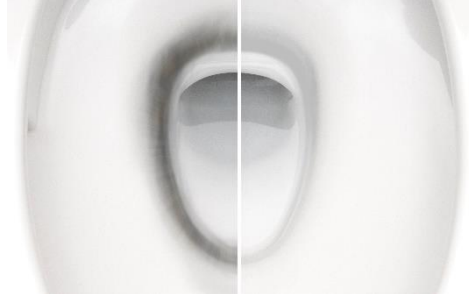
(左)「ウルトラファインバブル プレケアミスト」機能なし (右)「ウルトラファインバブル プレケアミスト」機能あり ※1