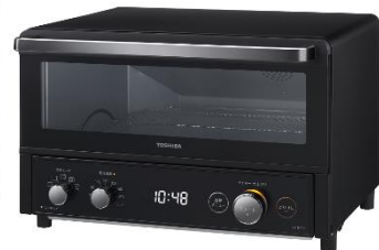
コンベクションオーブントースター 「HTR-R8」