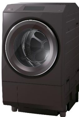
ドラム式洗濯乾燥機 ZABOON「TW-127XP1」

当社は、世の中や生活様式が変化しても変わらない一人ひとりの大切な想いや普段の使い勝手を追求し、安心して豊かに暮らすことを支える生活家電をコンセプトに、デザイン開発に取り組んでいます。今後も、当社は、外観デザインの美しさや空間との調和、快適な操作性や優れた機能性など細部にまで徹底的にこだわった製品の新たな価値創出を目指してまいります。