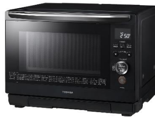
過熱水蒸気オープンレンジ 石窯ドーム「ER-WD80」