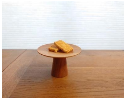
木工旋盤でスイーツスタンドづくり (ツバキラボ)