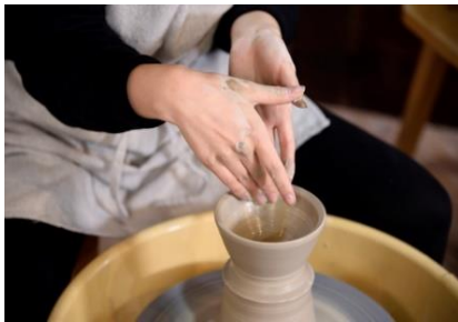
本格ろくろ体験 (studio record)

アクティブG 3階の「studio record」や岐阜市の会員制シェア工房「ツバキラボ」、飛騨市の木工房とものづくりカフェ・体験型宿泊施設「FabCafe Hida」、郡上踊り下駄の制作・販売を手掛ける「郡上木履」などが多様なワークショップを実施。木工旋盤といった機材を使用した8種のワークショップで本格的なモノづくりもお楽しみいただけます。