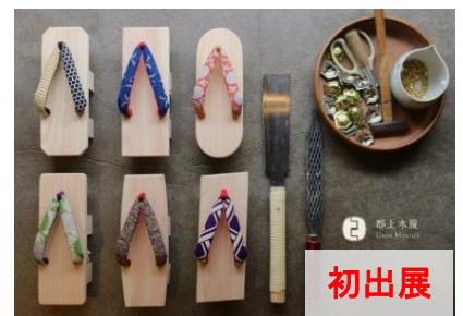
郡上のヒノキで踊り下駄づくり (郡上木履)