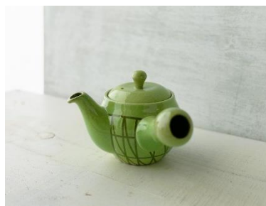
茶こしまで作る萬古焼急須 (studio record)