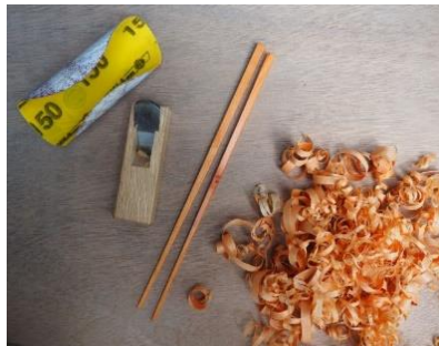
飛騨の広葉樹でつくる「お箸」「アイススプーン」「バターナイフ」づくり (株式会社飛騨の森でクマは踊る/FabCafe Hida)