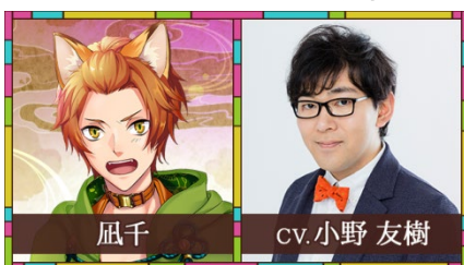
凧千(ナチ) / CV.小野 友樹