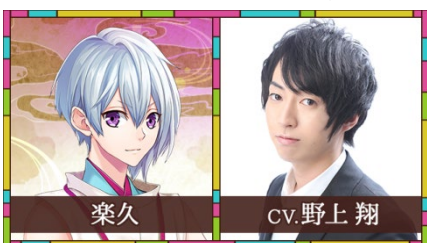
楽久(ガク) / CV.野上 翔