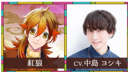
紅狼(クロウ) / CV.中島 ヨシキ