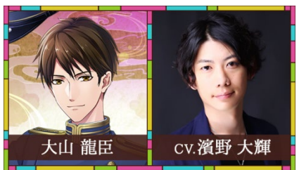
大山 龍臣(オオヤマ タツオミ) / CV.濱野 大輝