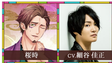
桜時(オウジ) / CV.細谷 佳正