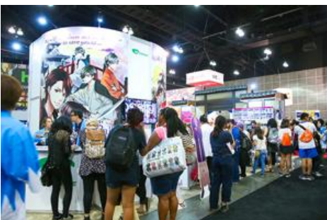
▲ブースに集まる、海外の恋アプリファンたち

3度目の出展となった2016年は、恋愛ドラマアプリ最新作“Era of Samurai: Code of Love”(邦題:新選組が愛した女)の世界観をブースに展開し、2,000名を超えるお客様にお楽しみ頂きました。