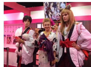
キャラクターイメージ 以前の出展時