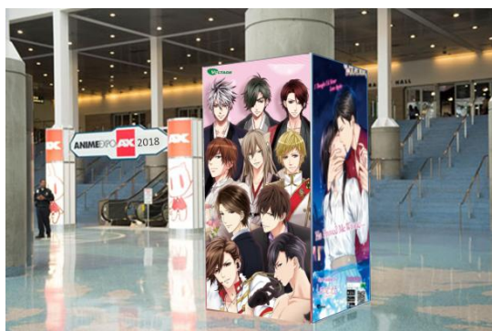
コラムラップ 掲示イメージ