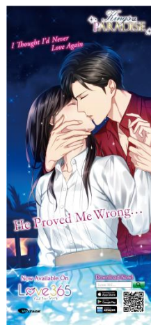
至極の男 ～もう一度愛される夜～