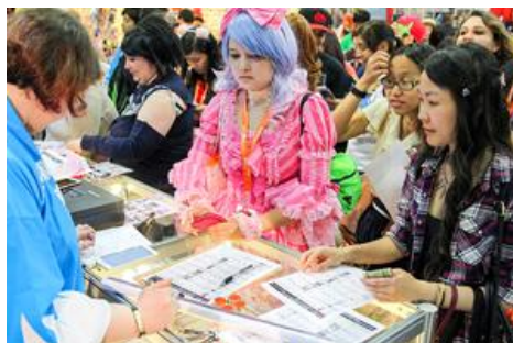
▲長蛇の列となった物販コーナー