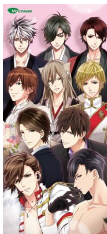
ボルテージ 人気キャラクター集合