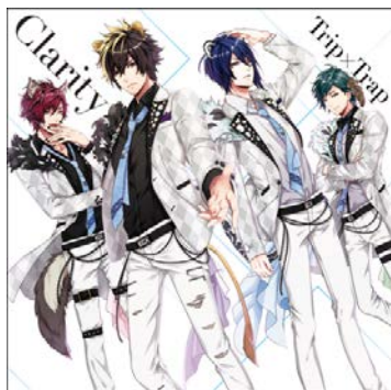
◆Clarity『Trip × Trap』 品番: PCCG-70405 / 1,250円+税