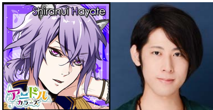
不知火颯 CV: 白井悠介