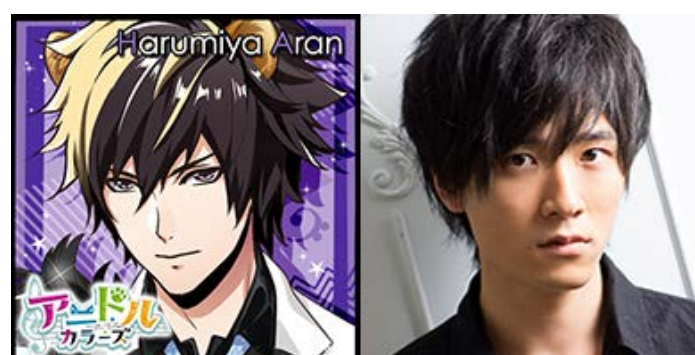
春宮亜蘭 CV: 畠中祐