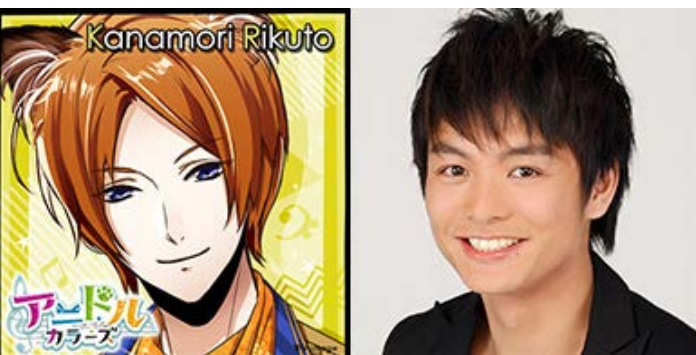
金森碧叶 CV: 榎木淳弥