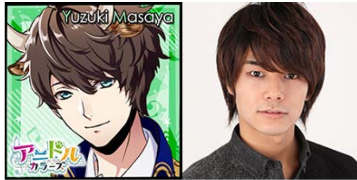
柚木真哉 CV: 八代拓