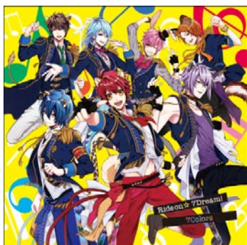
◆7Colors『Ride on ☆ 7 Dream !』 品番: PCCG-70404 / 1,250円+税

アニメイト URL: https://www.animate.co.jp/event/122759/