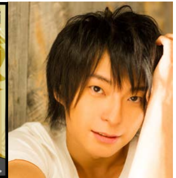
司東真幸 CV: 柿原徹也