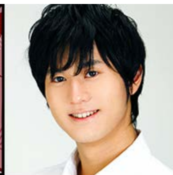
寿秋誉 CV: 武内駿輔