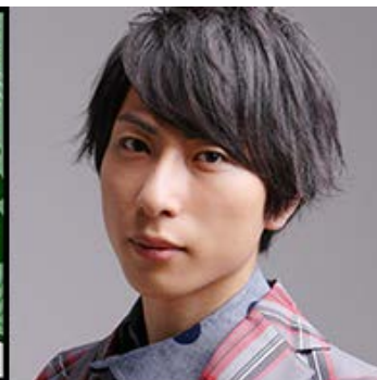
冬弥要 CV: 森嶋秀太