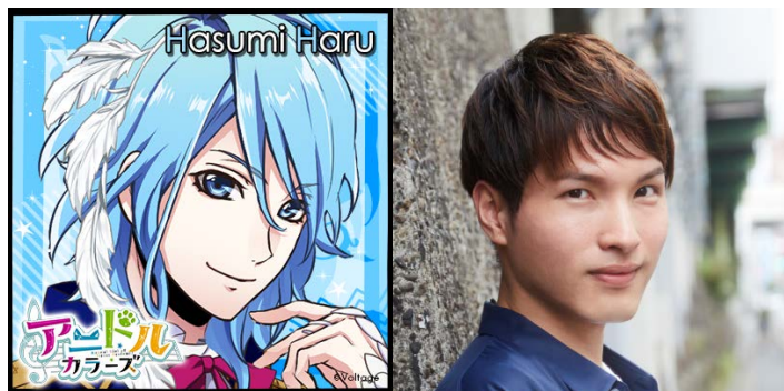
蓮水巴瑠 CV: 鈴木裕斗