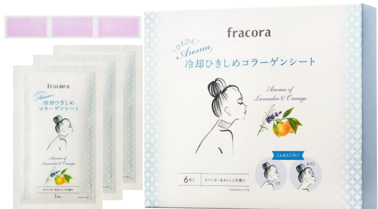
ひえひえ Aroma 冷却ひきしめコラーゲンシート(6枚入り)