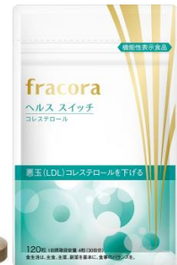
ヘルス スイッチ コレステロール