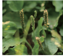
セイヨウオオバコ 種子エキス