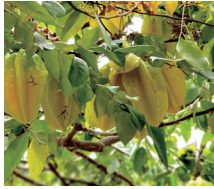
スターフルーツ 葉エキス