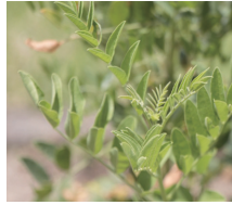
カンゾウ葉エキス