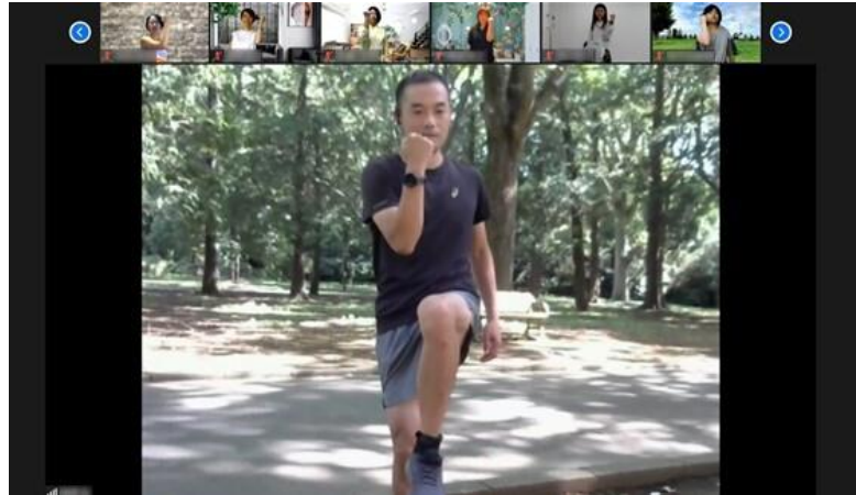
朝のエクササイズ ライブ配信の様子

人生100年時代と言われ、元気で人生を楽しめる健康寿命を延ばす活動が注目されています。