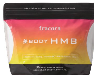
『美 BODY HMB』

フラコラは運動・食事・睡眠を基本とした良質な生活習慣こそが美と健康を維持するための大切な要素と考え、それらを実現するメソッドとそれをサポートする美容健康食品・化粧品を組み合わせた提案でミドルエイジ女性の5年後・10年後までを見据えた美ボディ・美肌・美髪を応援しています。運動においては“ベストスタイルスマートダイエット”という理念を掲げています。これは単に痩せているのではなく、ほど良い筋肉によって引き締まった、メリハリのあるバランスのいい体型、自分自身が心地よく軽やかなカラダこそが真に美しく健康なのであり、大人の女性のそのようなスタイルづくりを応援しようという考え方です。筋肉量は年齢と共に減少し、20代を100とすると、40歳で80%、40歳以降は毎年1%ずつ減っていきます。そこで、年齢を重ねても、美ボディを育むために、良い運動習慣を継続的に実践したいと考える方を後押しするサプリメントを開発しました。新しい生活様式に伴い、運動の仕方も見直される中、新時代のニーズにも応える新製品です。