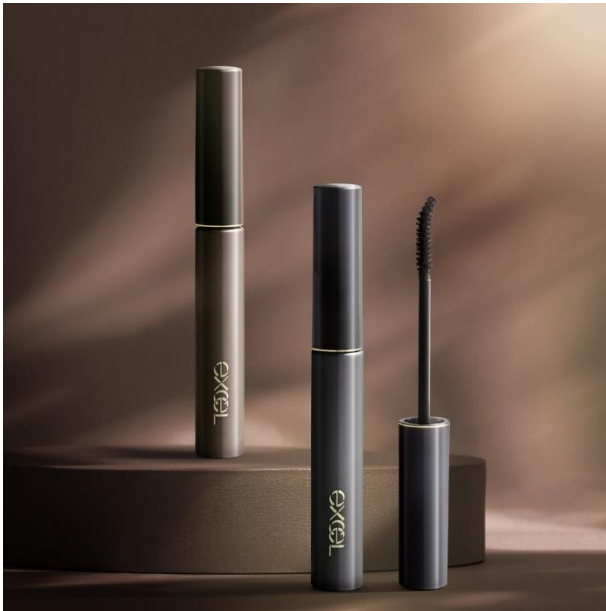
サナ エクセル ラッシュオプティミズム

まるで自まつげがそのまま伸びたかのような自然な仕上がりで、上向きまつげが続く「ラッシュオプティミズム」。商品名には、楽観主義(オプティミズム)から、美しいまつげの仕上がりで気分も上げられる商品にしたいという想いを込めました。ロング効果・ボリューム・カールキープ力のすべてを妥協せず作った、どんなメイクにも合わせやすいマスカラですので、ぜひ日常のメイクに取り入れて、仕上がりの美しさを楽しんでいただきたいアイテムです。