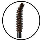
目元のカーブにフィットする オリジナルアーチブラシ