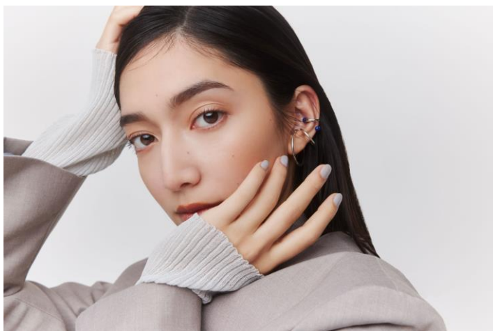
モデル使用色:サナ ニューボーン パーフェクトアイブロウ 03

一人一人の“正解アイブロウ”を毎日誕生させたいという想いでリブランディングした『サナ ニューボーン』。眉メイクに自信のない方もテクニック要らずで思いのままの眉を描ける、25年の歳月を経て作り上げた自信作です。