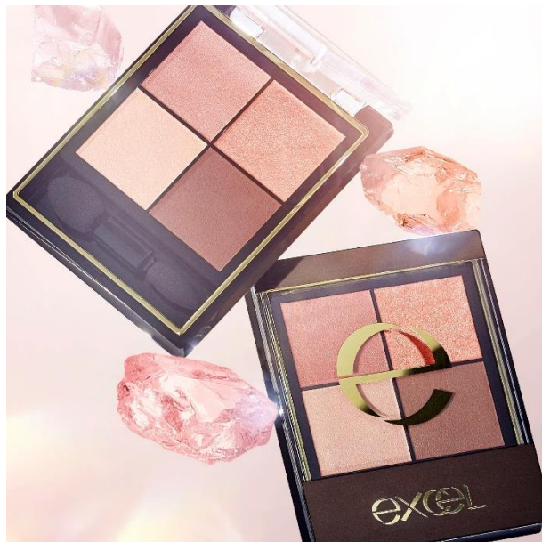
サナ エクセル リアルクローズシャドウ CX08 (クオーツリング)

同日発売の「エクセル ネイルポリッシュ N NL51~NL53」も天然石をモチーフにした限定コレクション。合わせ使いにぴったりカラーリングで、夏の目元と指先をきらめきで彩ります。