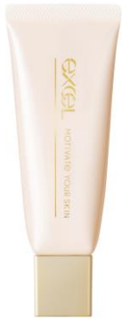
(エクセル モチベートユアスキン)