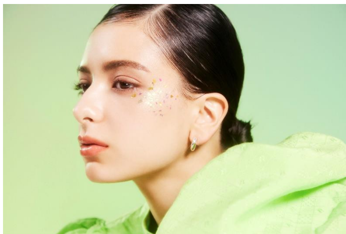
モデル使用色 エクセル スキニーリッチシャドウ SR06、 エクセル パウダー&ベンシル アイブロウEX PD07