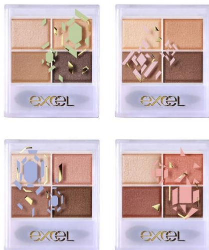
エクセル スキニーリッチシャドウ ( ' 23 ) SR01 (左上)・SR03 (右上)・SR06 (左下)・SR11 (右下)