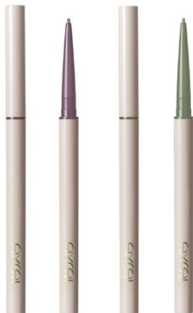
(左から: エクセル ニュアンスフル ペンシルライナー NP06・NP07)