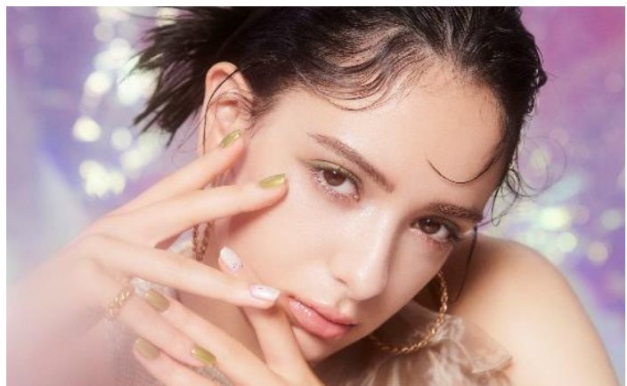
(モデル使用色:エクセル ニュアンスフル ペンシルライナー NP07)