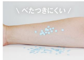
▲ノブ スキンミルク Dを塗布後、紙のをせ腕を傾けた写真