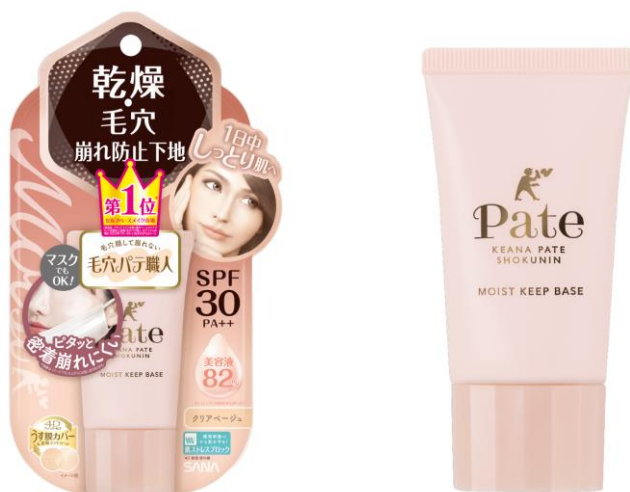
サナ 毛穴パテ職人 乾燥防止下地 25g 1,200円（税込1,320円）