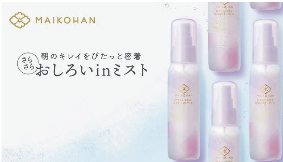
サナ 舞妓はん メイクキープおしろいミスト 75mL 900円（税込990円）