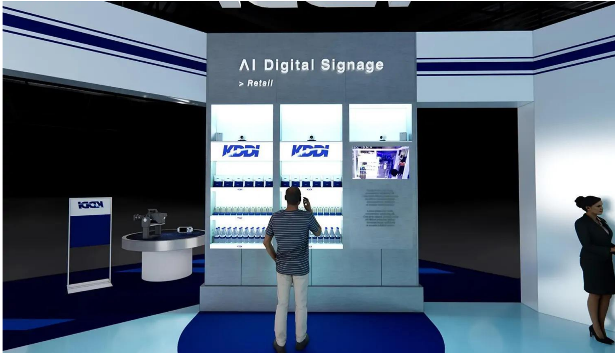
当社が技術協力した「AIデジタルサイネージ」の展示イメージ