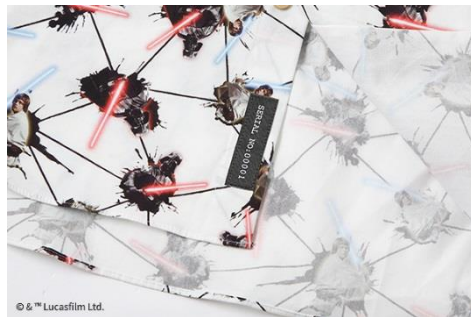
シリアルナンバー入り