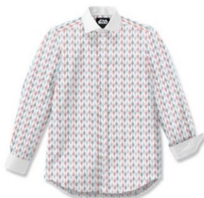
ミレニアムファルコンの 生地を使用したドレスシャツ

STAR WARSシリーズを大人のスタイリングの中にも気軽に楽しんでほしいという思いから、Original Stitchのカスタムコレクションの1つとして誕生しました。11月29日から3日間限定で開催されたオンライン先行受注会では予定枚数を上回り大変ご好評をいただきました。公式サイトでは、映画の公開順にエピソード4, 5, 6に登場するキャラクターの中から31柄をオリジナルプリントとしてデザインし、思い入れのあるSTAR WARSシャツをカスタマイズしていただけます。また、今回のコラボレーションでは、31柄にあわせた無地7種の生地とドレスシャツも加わり、オンにもオフにも着こなしていただける展開になっています。