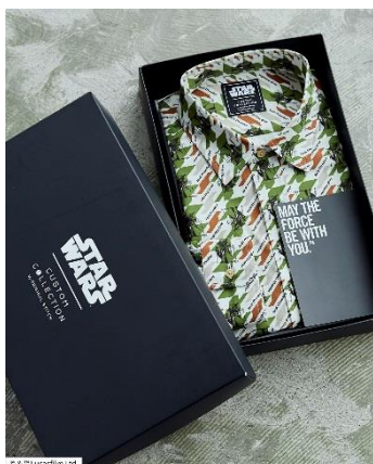
オリジナルボックス+カード付き

Instagram : https://www.instagram.com/original.stitch_custom/