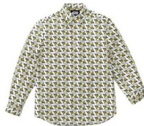
C-3POの 生地を使用したカジュアルシャツ