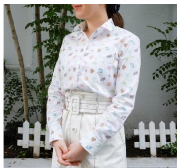
▲レディースシャツ着用例