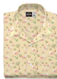
▲リラックスシャツ