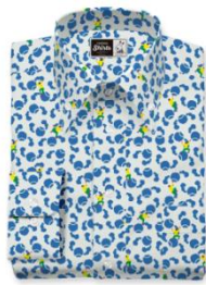
▲カジュアルシャツ