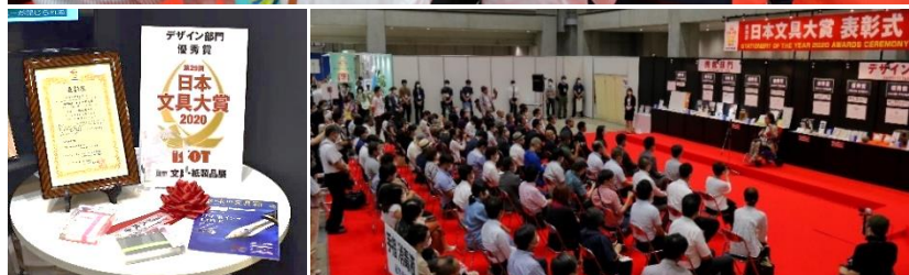
＜出展製品と会場の様子＞