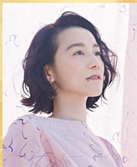
篠原ともえ氏 (デザイナー/アーティスト)