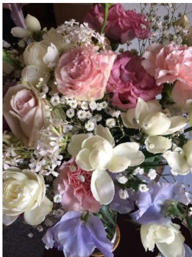
「某送別会でもらった花束」 猫と陽だまり