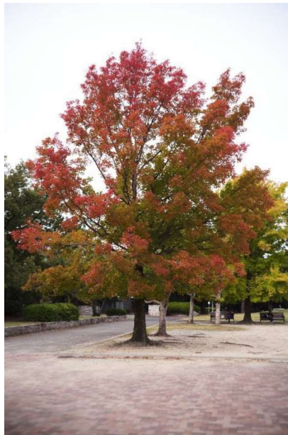
「この木の前で記念撮影」 H.Y