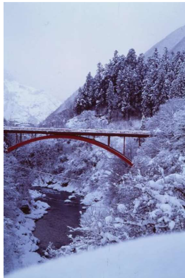
「静寂の朝」 鳥羽 浩治