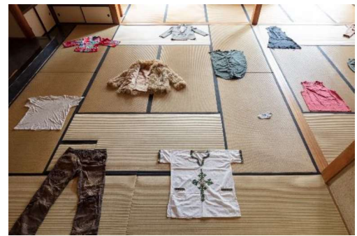
いらぬ服に別れを - adieux aux vêtements inutiles 2020年 インスタレーション © 麥生田兵吾