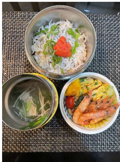
「エール弁当で、未来への一歩 の後押しを」 Bento by Mom