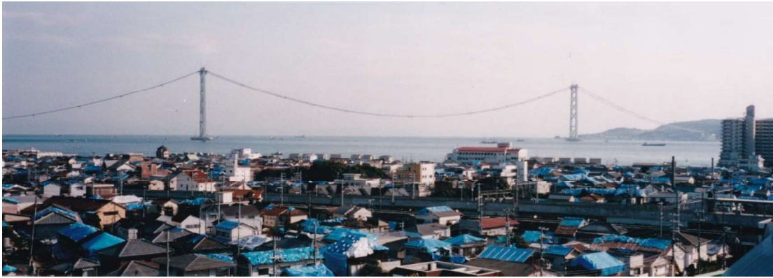
「明石海峡大橋展望」 長谷川平蔵