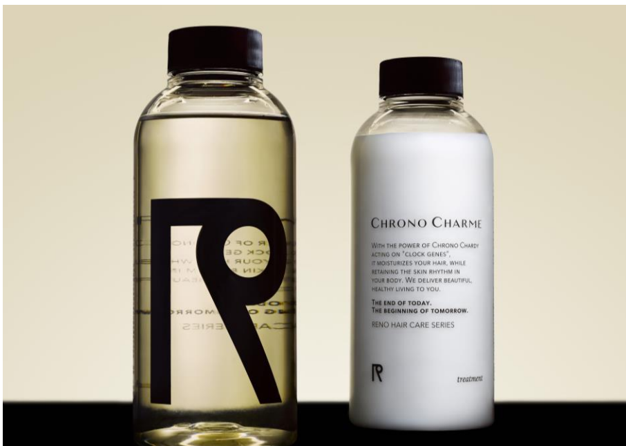
左：クロノシャルム シャンプー／右：クロノシャルム トリートメント

『CHRONO CHARME』は、頭皮にも存在する「時計遺伝子」に着目して作られたヘアケアシリーズとして誕生しました。2019年11月の発売以降、男女問わず多くの方に親しまれてきました。