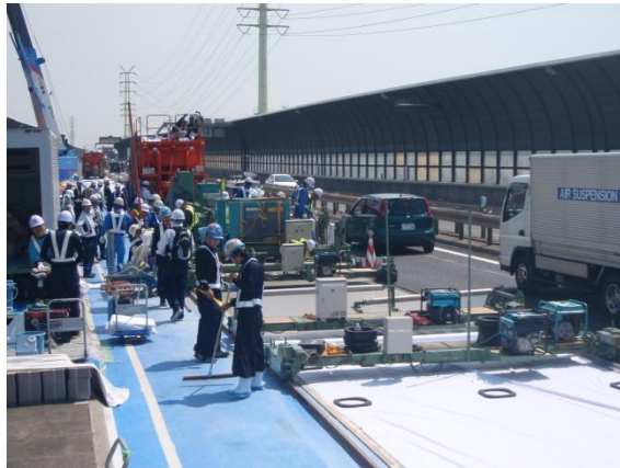
写真-1 鋼繊維補強コンクリート施工状況