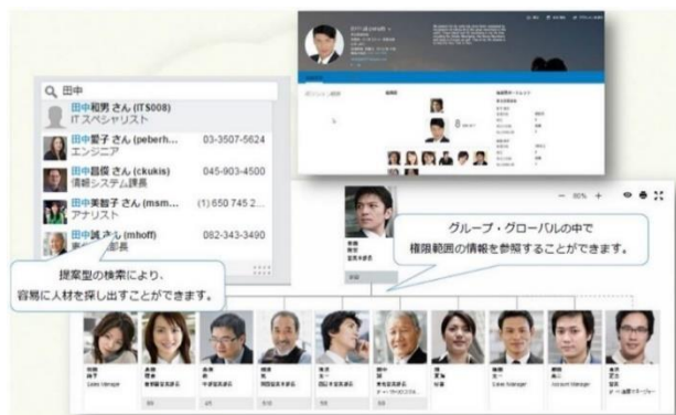
「Ulysses／ECPAY-Standard」社員プロフィール

今後もオデッセイは、ITを利用して従業員の特性を踏まえた適材適所配置、人材育成、評価、選抜人事が実現できる環境の構築や、定型業務を従業員に代わって処理できる RPA ソリューションを提供するなど、SAP の機能を活かし、合理化したシステムを提案・構築することでお客様の人事業務効率化、働き方改革の実現を図ってまいります。