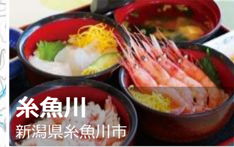
糸魚川 新潟県糸魚川市