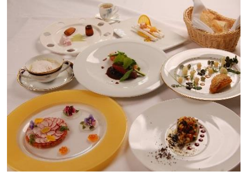
メインダイニング「りんどう」『festival des arts』