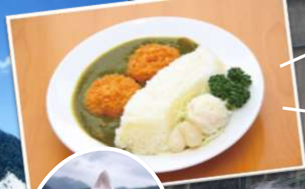
名物！黒部ダムカレー