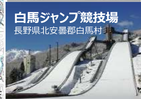
白马ジャンプ競技場 長野県北安曇郡白马村