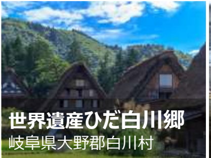
世界遺産ひだ白川郷 岐阜県大野郡白川村