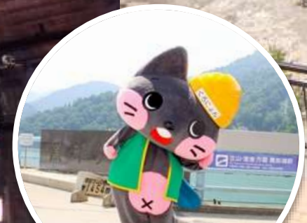
黒部ダムキャラクター くろによん