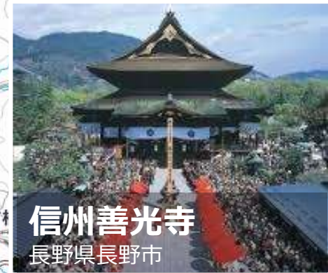
信州善光寺 長野県長野市