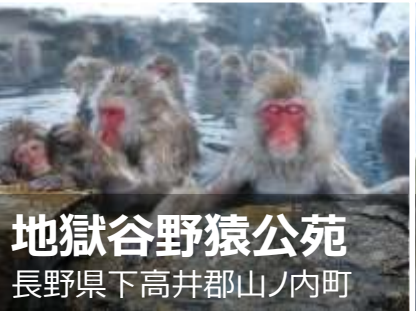
地獄谷野猿公苑 長野県下高井郡山ノ内町