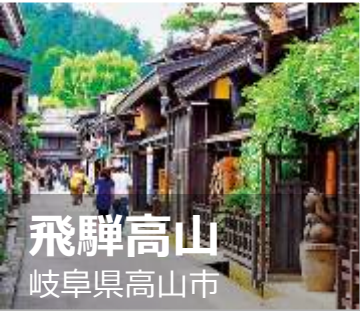
飛騨高山 岐阜県高山市