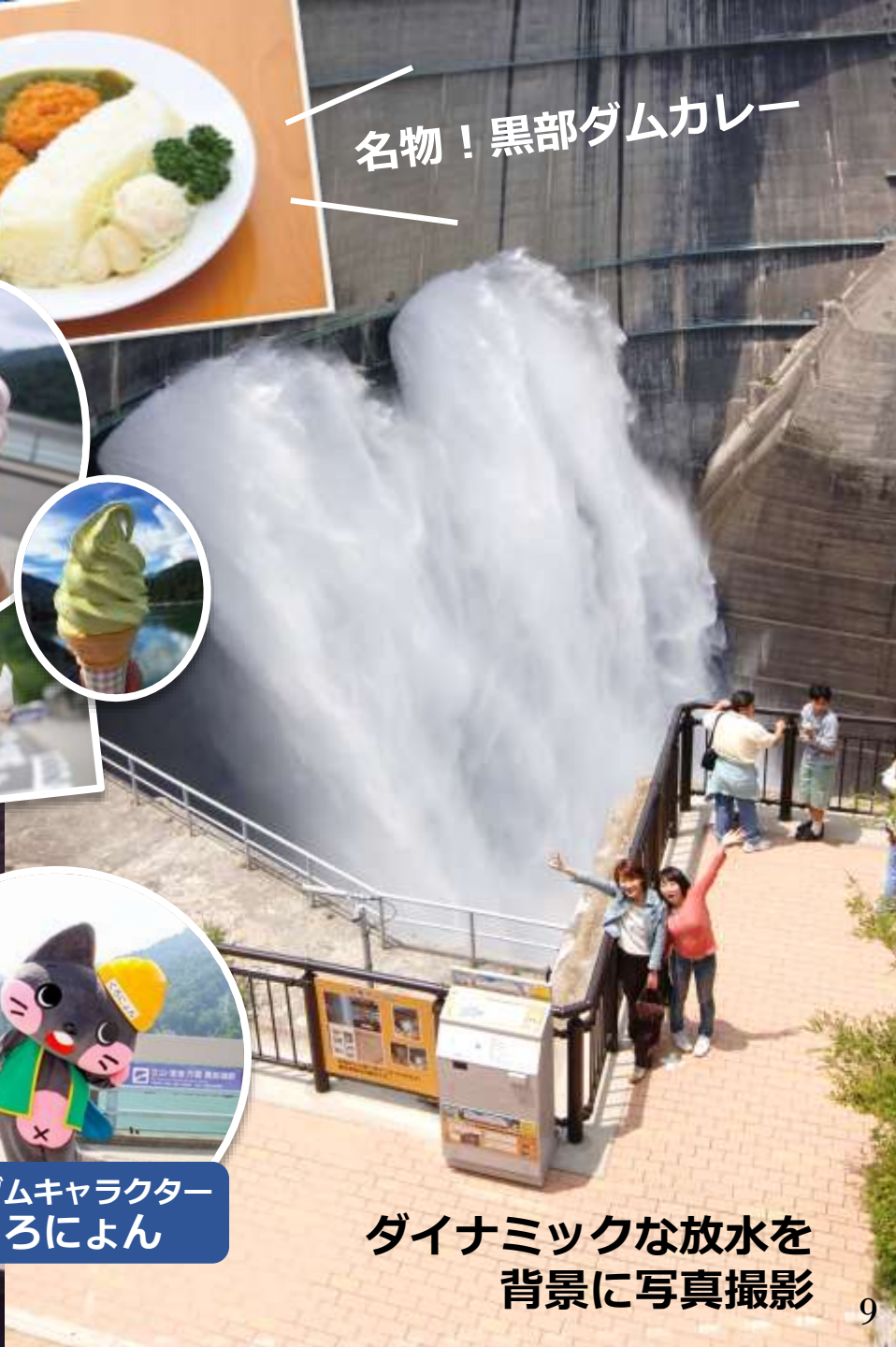
ダイナミックな放水を 背景に写真撮影