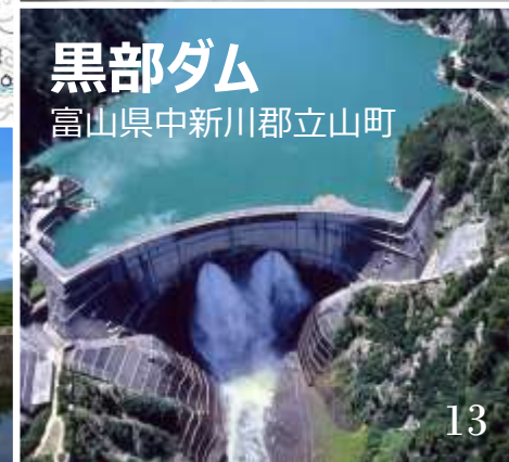
黒部ダム 富山県中新川郡立山町