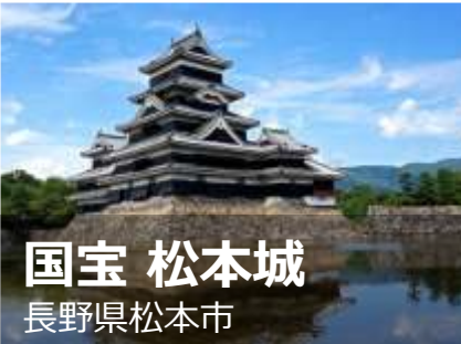
国宝 松本城 長野県松本市