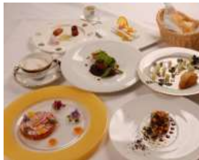
『festival des arts』

和三盆のオリジナルお菓子、小ふろしき、足袋下（くつした） デザインはお選びいただけません。国際芸術祭パスポート付き