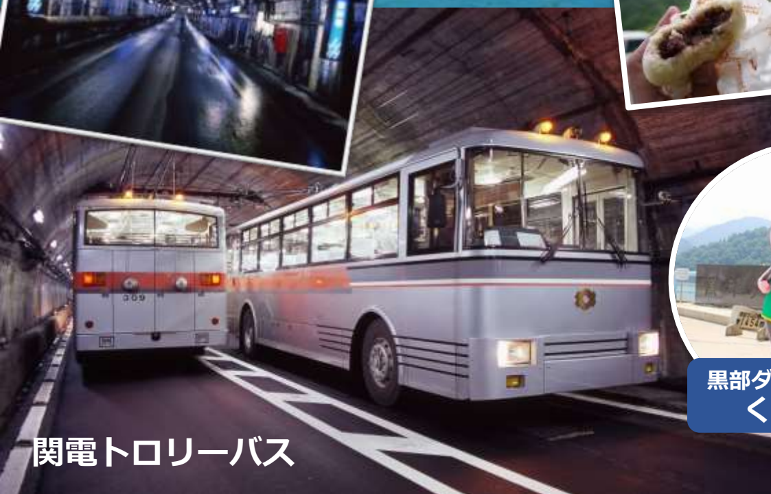
関電トロリーバス