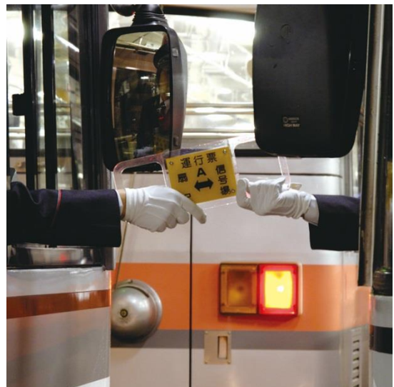
実際の交換風景（信号場）