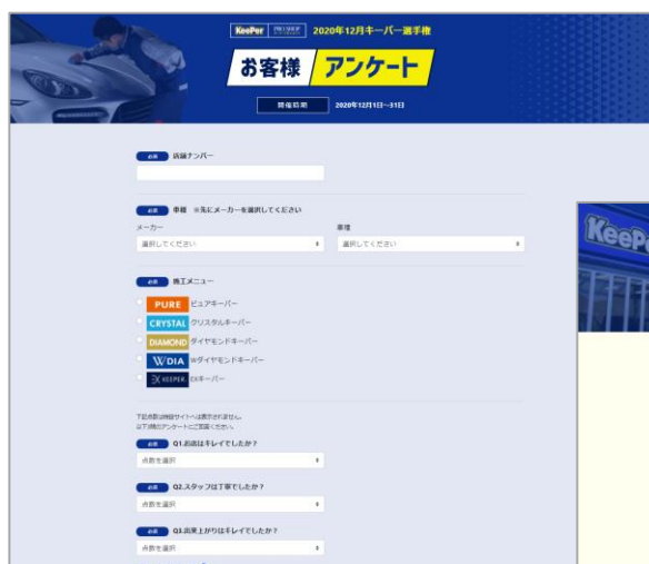
↑お客様アンケート（イメージ）

ぜひこの機会に、お近くの「キーパープロショップ」にてKeeperをご体験ください。