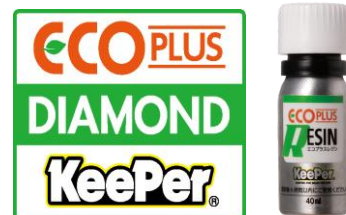
▲新製品『ECOプラスレジン』

「ECOプラスダイヤモンドキーパー」はベストセラー商品の「ダイヤモンドキーパー」の表面に、従来の『レジン2』の代わりに、新開発のケミカル『ECOプラスレジン』を施工した、雨が降れば洗車をしたようにキレイになる効果を備えた新感覚の商品です。