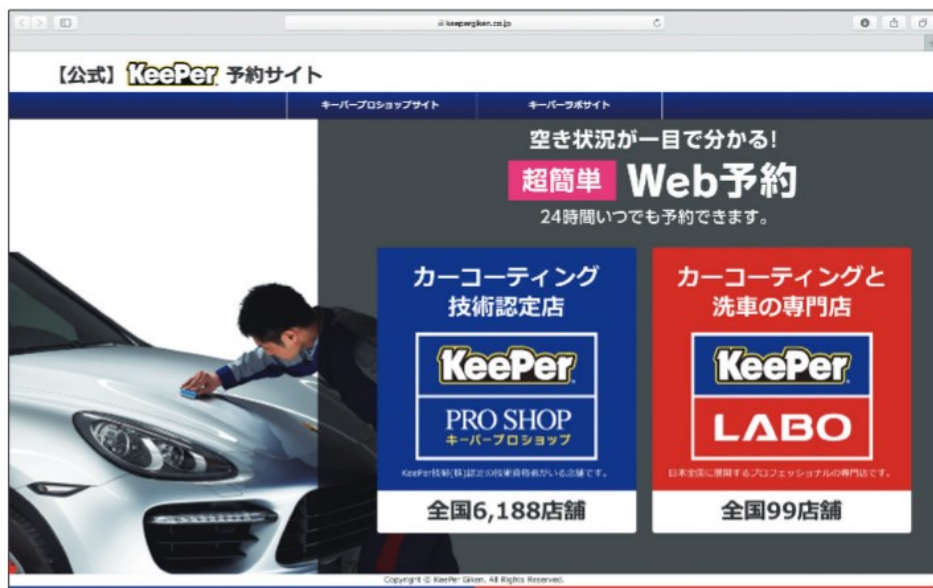
【公式】Keeper予約サイト パソコン画面