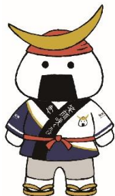
仙台・宮城観光 PR キャラクター むすび丸