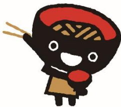
岩手県 PR キャラクター わんこぎょうだい そばっち