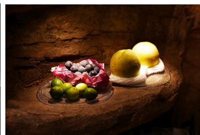
山川氏が自ら赴き選び抜いたフルーツ