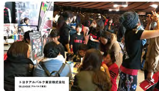
トヨタアルバルク東京株式会社 (B.LEAGUE アルバルク東京)