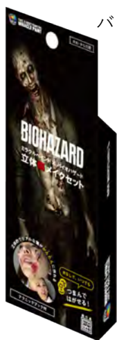
バイオハザード／ライセンス商品