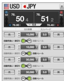
プライスボード画面