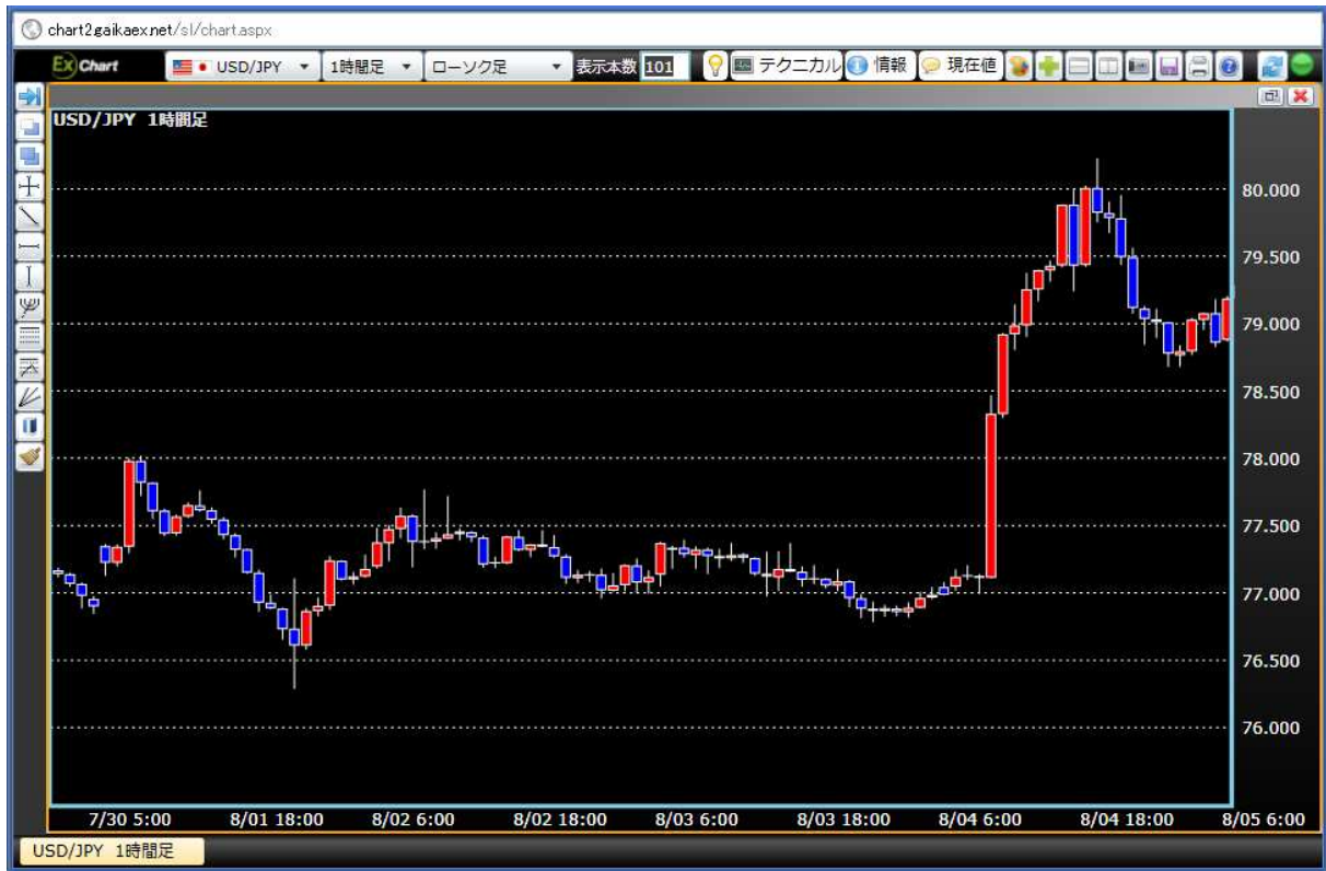
画面: 当社「Ex チャート」

※金融商品取引業等に関する内閣府令の一部を改正する内閣府令は、2010年8月1日より施行され、経過措置期間満了に伴い、2011年8月1日より、個人投資家による外国為替証拠金(FX)取引等において、取引証拠金の預託額が想定元本の2%以上から4%以上に変更となりました。