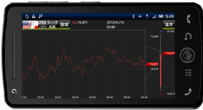
ティックチャート(日足表示)